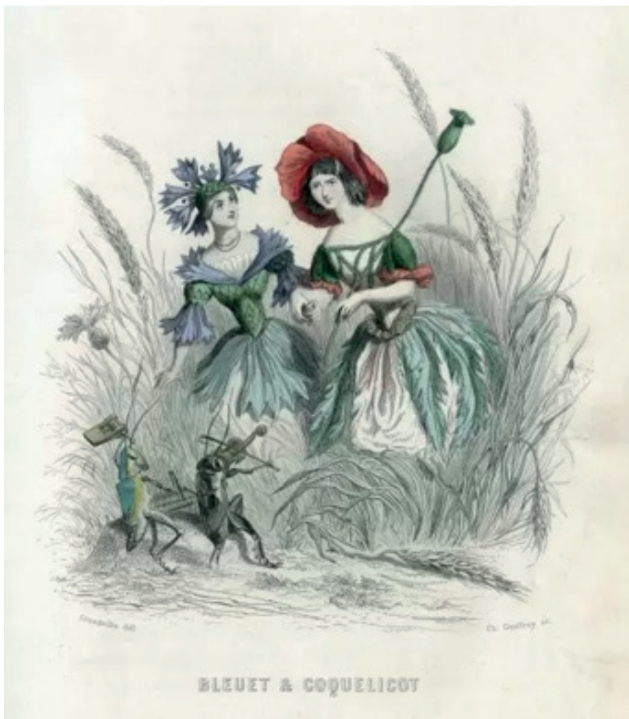
Fiordaliso e Papavero vanno a braccetto nel campo di grano nell'abile fantasia artistica di Grandville

polati dalle note archeofite: Centaurea cyanus L., Papaver rhoeas L., Anthemis cotula L. L'agricoltura estensiva e a basso input delle aree marginali consente lo sviluppo di specie importanti per la biodiversità soprattutto entomologica dato che si tratta di specie entomogame, visitate da artropodi (apoidei, ditteri, lepidotteri e coleotteri). In pieno impressionismo, alla fine dell'800, Claude Monet (1840-1926), fondatore dell'impressionismo francese, e Giuseppe de Nittis (1846-1884), pugliese emigrato in Francia, amante della pittura dal