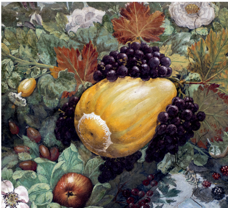
Particolari degli affreschi della Loggia di Villa La Farnesina, Roma

perdendo, su scala globale, al ritmo dell'1-2% l'anno. La concentrazione delle multinazionali delle sementi in grandi aziende ha inglobato o cancellato alcuni programmi di selezione vegetale per ridurre i costi. In futuro ci saranno meno coltivatori di ortive e i coltivatori dipenderanno da un patrimonio genetico più ristretto, quasi sempre di proprietà di multinazionali e soggetto a royalty, il che potrebbe contribuire, in un prossimo futuro, all'insicurezza alimentare. I numeri del Catalogo Comune delle varietà degli ortaggi (37° edizione, 2018) sembrerebbero apparentemente contrastare questa visione catastrofica, poiché sono censite più di 20.000 accessioni. Si tratta, però, del frutto di un miglioramento genetico gestito a livello internazionale che determina un esponenziale aumento del numero di varietà ibride. Sono poche le colture protagoniste: pomodoro, peperone e lattuga, ad esempio, da sole rappresentano oltre il 40% delle varietà registrate. Significativo è anche il fatto che il Paese più importante