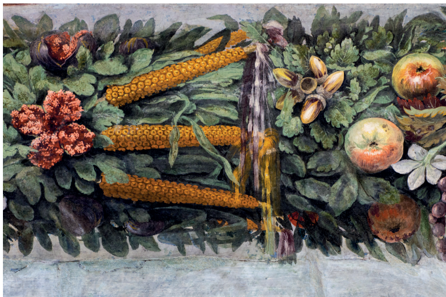
Particolari degli affreschi della Loggia di Villa La Farnesina, Roma