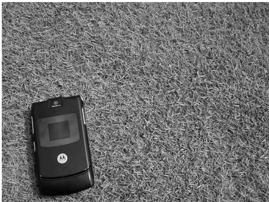
Fig. 3 « Zoysia » cv 'Diamond'

Zoysia japonica Steud. ha una tessitura più grossolana rispetto alle altre specie. La cultivar 'Meyer' è del 1951, ciononostante è ancora molto diffusa, sviluppa un tappeto erboso molto denso, presenta un lungo periodo di dormienza invernale (Fry e Dernoeden, 1987), una profondità radicale relativamente scarsa e una limitata capacità di evitare stress idrici (Marcum et al., 1995).