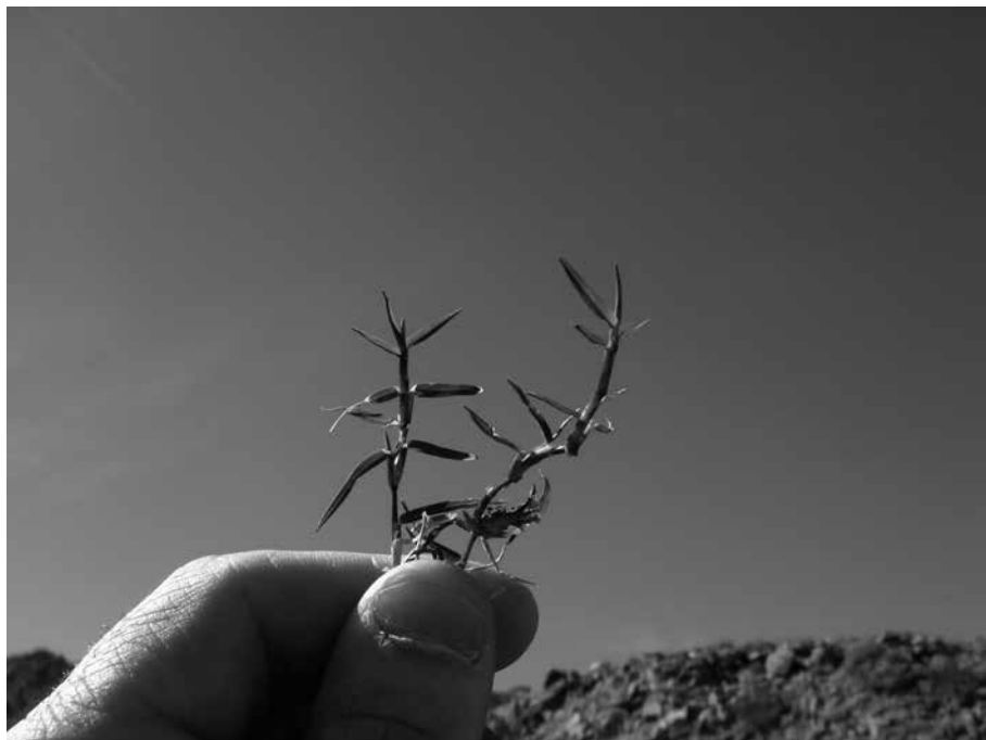
Fig. 1 « Cynodon » ibrida 'Tifdwarf'

nuta per una mutazione indotta di 'Tifway' e presenta un'eccellente capacità di recupero, abbondante produzione di rizomi, buona resistenza alle basse temperature e tollera altezze di taglio inferiori a 4 cm.